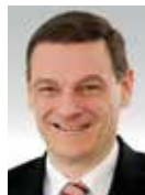
Franz Loogen e-mobil BW GmbH