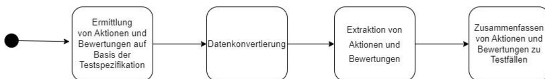
Abbildung 1: Konzept zur Abstraktion der Testfälle

Sobald die Aktionen und Bewertungen definiert wurden, kann in die zyklische Abarbeitung der Messdaten gestartet werden. Dieser Prozess besteht aus vier Schritten (siehe Abbildung 1).