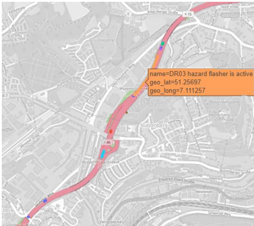
Abbildung 3: Aktionen in Bezug zur Kartenposition

Zusätzlich könnten GPS-Positionen, die während der Fahrt aufgezeichnet werden, auf interessante oder kritische Straßenpunkte untersucht werden. Dadurch würde sich eine zusätzliche Informationsquelle ergeben, die möglicherweise mehr Aktivierungen oder Prüfungen ermöglicht (Abbildung 3).